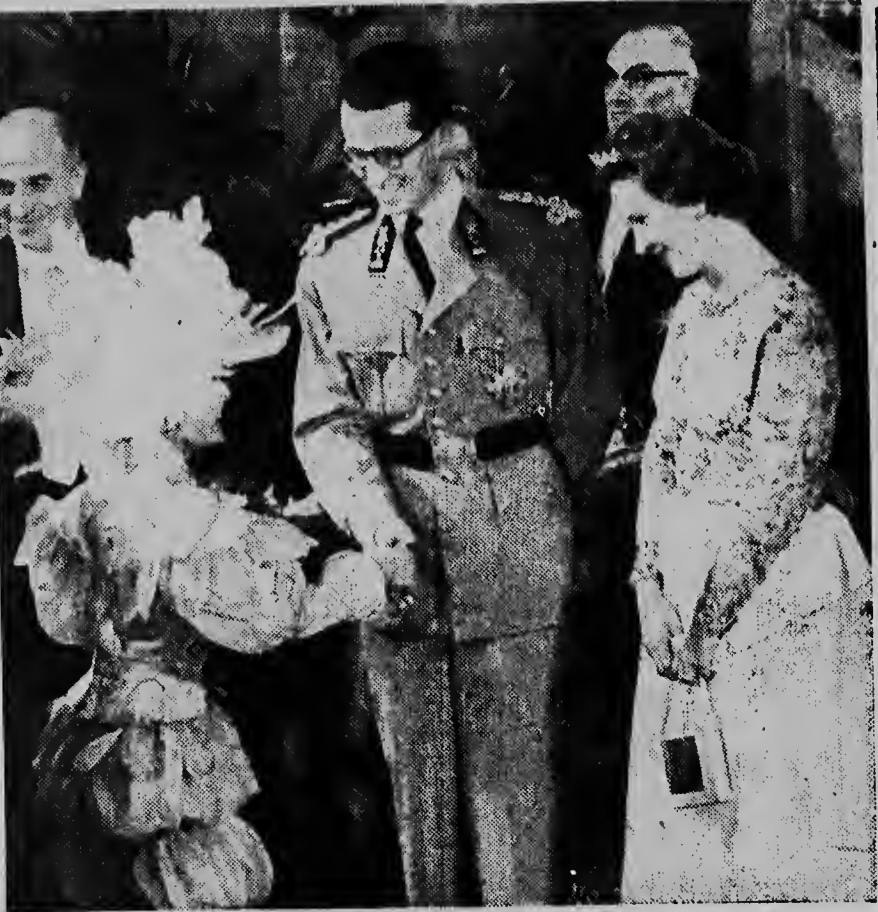
HUESPEDNAN REAL A ASISTI NA NOCHI DI GALA DI PRENSA BELGICANA. — S.M. Rey Baudewijn in S.M. Reina Fabiola di Belgica a asisti Dia Luna nochi siman pasa na Brussel na e nochi di gala di Verenigde Algemene Belgische Pers. Riba e portret aki nos ta mira un dje cooperadoran di mas chiquito di „Toverfluit”, opera di Mozart, cu a ser presenta e anochi aki, ta haci su saludu di cortesia cerca e pareja real.